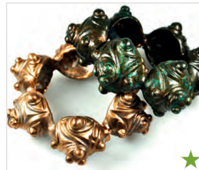
Repliken eines keltischen Fuhringpaares aus Erding-Klettham, das bereits 1860 entdeckt wurde (ca. 350-220 v. Chr.).

Wurde zu Beginn noch in kleinen Grabhügeln bestattet, wird ca. ab dem 4. Jahrhundert v. Chr. die Flachgräbersitte zur Regel. Aus Erding sind zahlreiche Grabgruppen bekannt geworden, so aus Siglfing, Erding, Klettham, Langengeisling und Kehr. Erst dieses Frühjahr wurden erneut in Langengeisling vier Gräber aus der Zeit um 300 v. Chr. entdeckt.