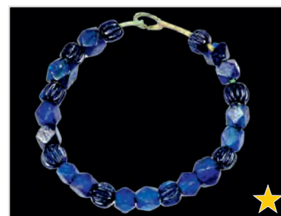
Spätantike Glasperlenfunde aus einem Frauengrab aus dem Gewerbegebiet Erding-West

Römische Fundstellen finden sich in Erding beiderseits der Sempt (gelbe Fundpunkte). Die landwirtschaftlich ertragreichen Landschaften des Erdinger Gäus boten beste Voraussetzung zur Anlage römischer Landgüter. Ausschlaggebend war die Lage an günstigen Transportwegen, den Römerstraßen. Von Norden nach Süden durchzog die sog. „Sempttalstraße“ das heutige Erding. 1912 wurde bei Langengeisling ein aus Tuffsteinmauern errichtetes Landgut mit Fußbodenheizung entdeckt. Von dort stammt auch ein 1936 geborgener Silbermünzschatz aus 300 Münzen, der beim Fliegerhorst-Bau auftauchte. Vermutlich wurde er im Zuge der verheerenden Alamannen-Einfälle um 233/35 n. Chr. vergraben.