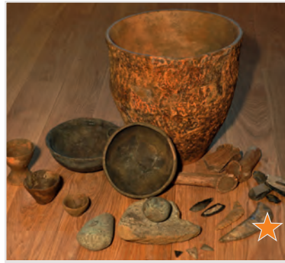
Funde aus der jungsteinzeitlichen Siedlung der Altheimer Kultur: Gefäßkeramik, Pfeilspitzen und Feuerstein-Sicheln.

Die ältesten Siedlungsspuren im Stadtgebiet von Erding stammen vom Ende der Jungsteinzeit (orange Fundpunkte). Der bedeutendste Fundplatz liegt im Bereich der heutigen Gärtnerei Ippisch am Fuß des Fuchsbergs. Dort konnte 1949 überraschend in 1,50 m Tiefe eine Siedlung der sog. Altheimer Kultur (3800-3200