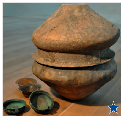
Urnengrab aus einer Kiesgrube bei Langengeisling (um 1.100 v. Chr.). Neben der Urne wurde eine Bronzetasse und ein Sieb beigegeben.

Die Fundstellendichte steigt während der Bronzezeit (2300-800 v. Chr.) im Stadtgebiet stark an (blaue Fundpunkte). Der neue Werkstoff Bronze veränderte die Welt. Die bis dahin auf reiner Selbstversorgung basierende Lebensweise leitete in eine arbeitsteilige, nach Berufsständen organisierte Gesellschaft über. Denn für die Bronze mussten Kupfer und Zinn prospektiert, bergmännisch abgebaut, verhütet, verhandelt und zu Schmuck, Werkzeug und Waffen weiterverarbeitet werden.