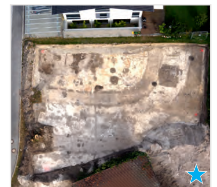
Senkrechtaufnahme der Grabungsfläche am Gaugrafenweg mit Doppelgrabenwerk des karolingischen Königshofes Ardeoingas vom 15.09.2016, Norden ist oben.

Vom karolingischen Königshof Altenerding/Ardeoingas zur Wittelsbacher Stadt Erding