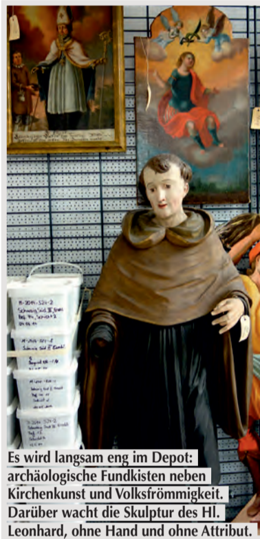
Es wird langsam eng im Depot: archäologische Fundkisten neben Kirchenkunst und Volksfrömmigkeit. Darüber wacht die Skulptur des Hl. Leonhard, ohne Hand und ohne Attribut.

Darum müssen sämtliche Informationen zu den Museumsstücken schriftlich festgehalten werden. Das passiert auch im Museum Erding elektronisch mittels