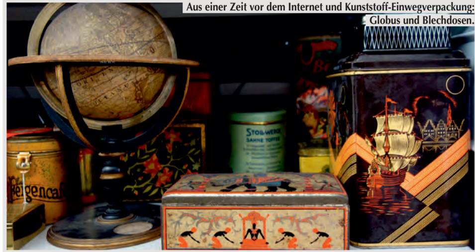
Aus einer Zeit vor dem Internet und Kunststoff-Einwegverpackung: Globus und Blechdosen.

Unter den zehntausenden Objekten in der Erdinger Museumssammlung befindet sich Schönes und Erbauliches (zum Beispiel Gemaltes oder Geschriebenes von hiesigen Künstlern und Schriftstellern), Kurioses (zum Beispiel ältester Kanaldeckel aus dem Stadtgebiet), Seltenes (zum Beispiel spätmittelalterlicher Pfarschatzschrank). Größtenteils sind es jedoch viele Dinge aus dem Alltagsleben vergangener Zeiten