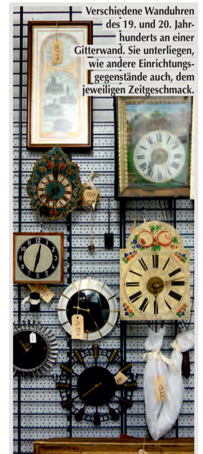
Verschiedene Wanduhren des 19. und 20. Jahrhunderts an einer Gitterwand. Sie unterliegen, wie andere Einrichtungsgegenstände auch, dem jeweiligen Zeitgeschmack.

Doch manchmal muss man auch ganz schnell reagieren und Dinge der Gegenwart sicherstellen, bevor sie wieder verschwinden – so geschehen ab März 2020, als das Museum Erding einen Bevölkerungsaufwurf initiierte, persönliche Gegenstände, Fotografien usw. zur Corona-Pandemie für die Sammlung abzugeben. Auch wenn man sich im Museum meistens mit der Vergangenheit beschäftigt, arbeitet man doch stets für die Zukunft!