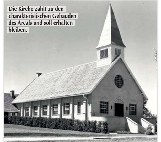
Die Kirche zählt zu den charakteristischen Gebäuden des Areals und soll erhalten bleiben.

Als Vorteile gegenüber dem bestehenden Bahnhof gelten die Nutzung von Synergien hinsichtlich Erschließung und Flächenverbrauch (zum Beispiel für das P+R-Angebot und den Busbahnhof) sowie die günstige Lage an Straßen, die nicht direkt durch das Stadtzentrum führen, und die kurzen Umsteigewege zwischen S-Bahn und überregionalem Verkehr. Ebenso von Vorteil sind das große Ausbaupotenzial für zukünftige bahnsseitige und städtebauliche Entwicklungen sowie die geringeren Investitions- und Unterhaltskosten.