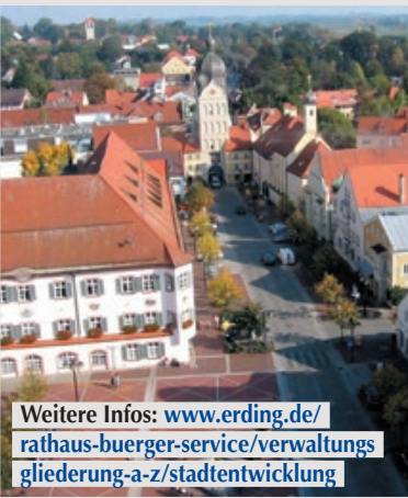
Weitere Infos: www.erding.de/rathaus-buerger-service/verwaltungsgliederung-a-z/stadtentwicklung

Unter dem Titel „ED 2050 Gap Closing“ entwickelten Absolventen des Masterstudiengangs Urbanistik an der Technischen Universität (TU) München während des Wintersemesters 2019/20 vier Szenarien, wie sich Erding in den kommenden 30 Jahren entwickeln könnte. Besonders berücksichtigten die Studierenden dabei den geplanten S-Bahn-Ringschluss und die angekündigte Konversion des Fliegerhorst-Geländes. Da die dann stark verbesserte verkehrliche Erreichbarkeit die Standortattraktivität zusätzlich steigern, müsse sich Erding als Teil der Metropolregion München im Spannungsfeld dieser Entwicklungen positionieren, betonen die Macher. Alle Szenarien berücksichtigen Wechselwirkungen mit anderen Bereichen der Stadt, beispielsweise der Altstadt oder den großen Gewerbeflächen im Westen. Die Studie ist Teil des Moduls „Urban Landscape 1“ und wurde vom Lehrstuhl für Raumentwicklung von Prof. Dr. Alain Thierstein initiiert.