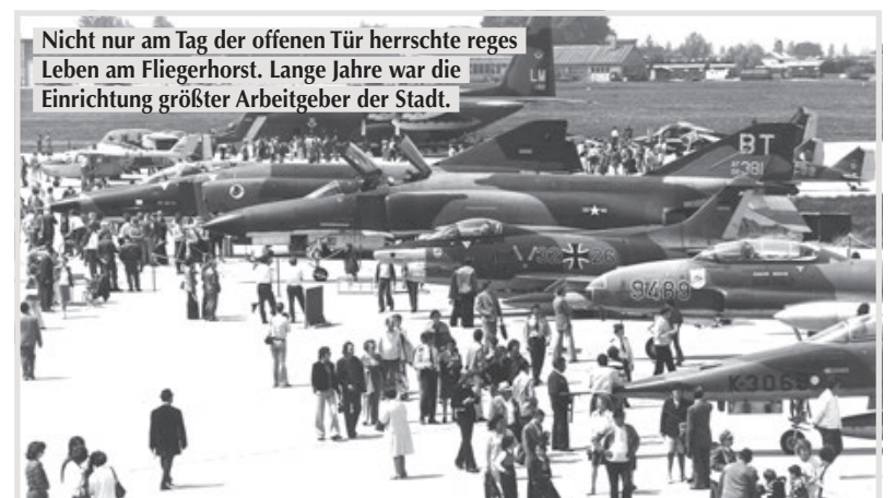
Nicht nur am Tag der offenen Tür herrschte reges Leben am Fliegerhorst. Lange Jahre war die Einrichtung größter Arbeitgeber der Stadt.