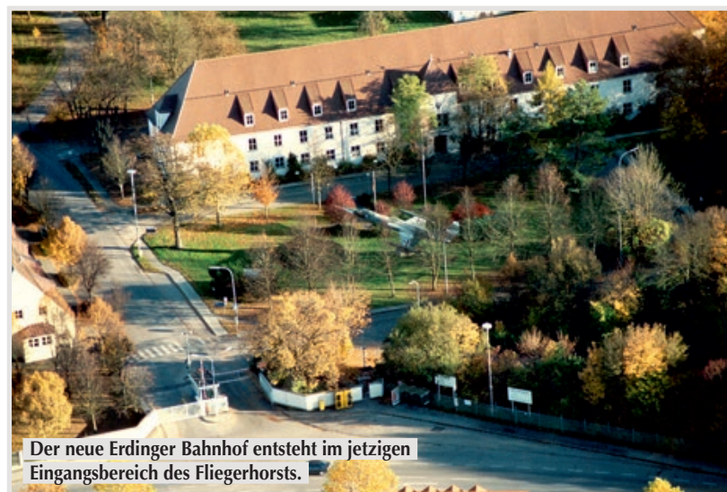
Der neue Erdinger Bahnhof entsteht im jetzigen Eingangsbereich des Fliegerhorsts.

Richtung Flughafen und die Gegenrichtung nach München vor. Im Verlauf der Walpertskirchener Spange wird ein dritter Bahnsteig für den überregionalen Verkehr in Richtung Mühldorf errichtet. Am nördlichen Bahnsteigende befindet sich das Verbindungsbauwerk.