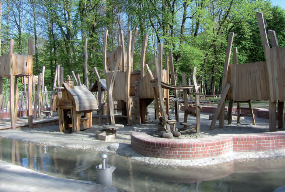
Die wohl interessantesten Spielplätze im Stadtgebiet sind die beiden im Stadtpark – wie hier die „Herzogburg“ beim Tiergehege.