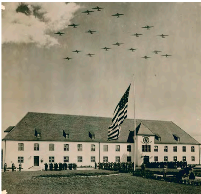
Die US-Airforce veranstaltete 1955 einen Flugtag im Fliegerhorst.

Die Stadt sucht im Zuge der anstehenden Konversion des Fliegerhorst-Geländes von der militärischen in eine zivile Nutzung Zeitzeugen mit engem Bezug zum Militärflughafen. Dabei könnte es sich um ehemals dort stationierte Soldaten, zivile Beschäftigte oder sonst dort tätige Personen handeln. Persönliche Erinnerungen zum Standort, konkrete berufliche Aufgaben, Arbeitsabläufe,