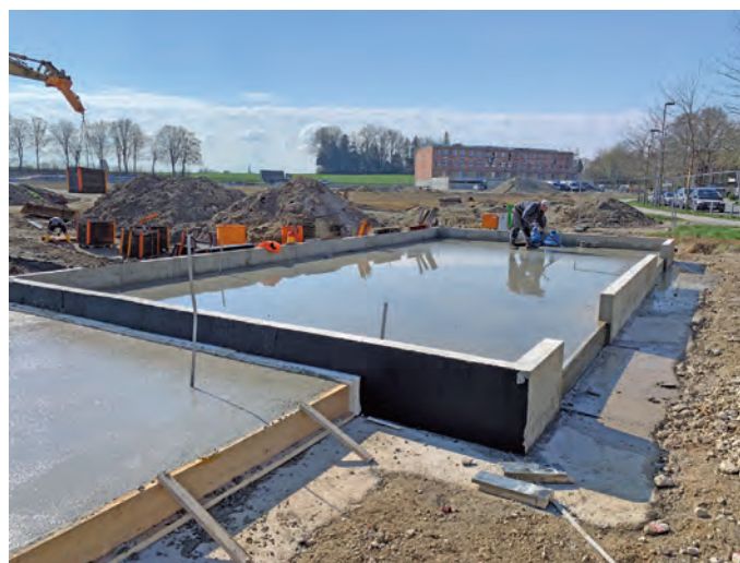
Auf den Bildern sieht man den Baufortschritt der Energiezentrale. Beginnend mit dem Erdaushub Ende März bis zum Gießen der Bodenplatte Mitte April.

Insgesamt wird die Fernwärmeleitung ca. 580 Trassenmeter lang sein und auf dieser Trassenlänge werden voraussichtlich 13 Wärmeübergabepunkte entstehen. Innovativ ist hier insbesondere die kostensparende Nutzung einzelner Wärmeübergabepunkte für mehrere Reihenhäuser zusammen, die eine zentrale Wärmebereitstellung für die mittlerweile sehr energieeffizienten Neubauhäuser überhaupt erst sinnvoll macht.