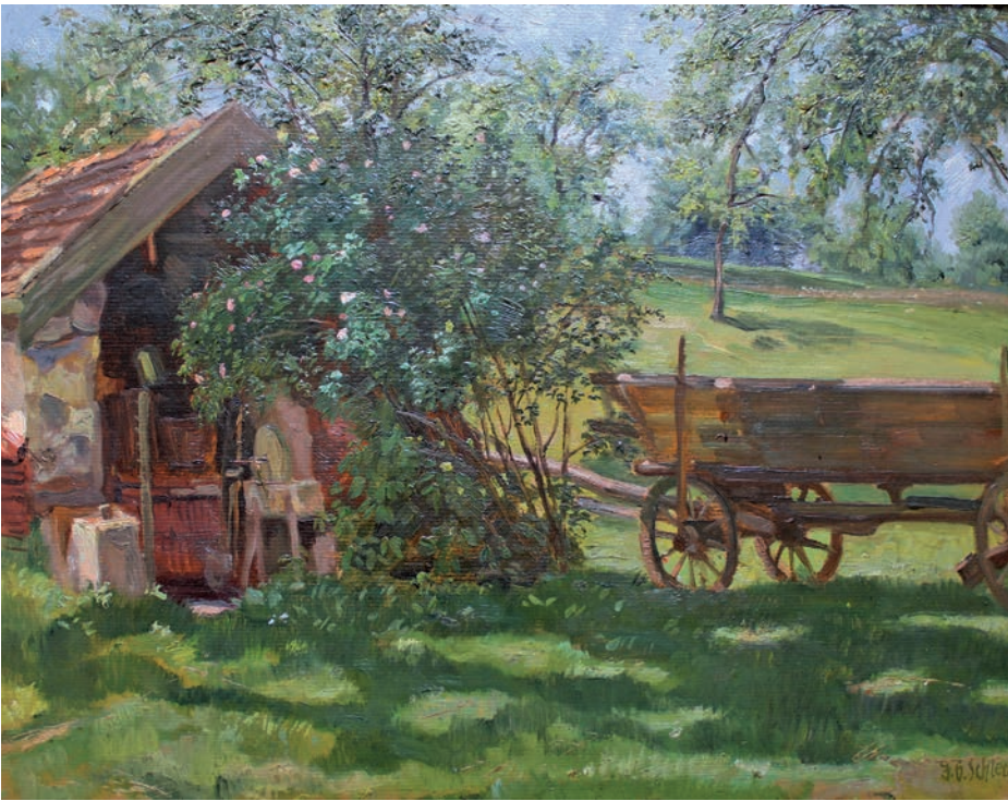
Das Gemälde „Backofen beim Lampl“ hängt heute im Museum Franz Xaver Stahl.