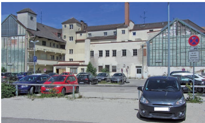
Wenn die Gebäude im Hintergrund beseitigt sind, wird der Parkplatz größer.