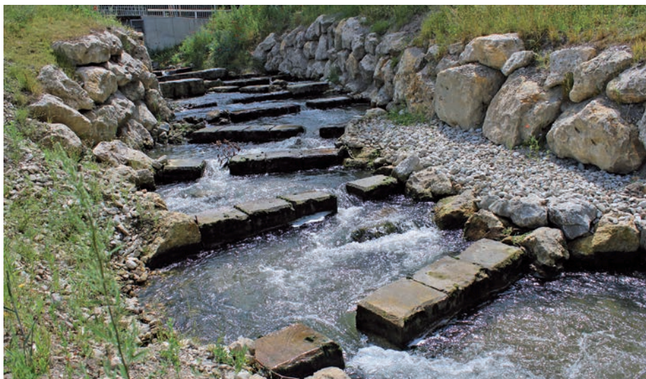
Die neue Fischwanderhilfe am Wehr hilft Fischen, verbessert das Klima und verschönert die Umgebung.

Das Wasserwirtschaftsamt München hat vor kurzem die neue Fischwanderhilfe am Stadtwehr offiziell ihrer Bestimmung übergeben. Damit Fische die Gewässer im Stadtgebiet ohne Hindernisse durchqueren können, errichtete die Behörde an der Westseite des Stadtwehrs einen Umgehungsbach zwischen der höhergelegenen Sempt und dem abzweigenden Fehlbach. Das umgangssprachlich als „Fischtreppe“ bezeichnete Bauwerk wurde dabei als naturnahes Raugerinne mit Beckenstruktur ausgeführt. Bisher versperrte das Wehr Fischen den Weg. Die laut Wasserwirtschaftsamt rund 1,1 Millionen Euro teure Baumaßnahme gestaltet die gesamte Grünanlage in der Umgebung um, da der Auf- und Abstieg eine zusätzliche Brücke für Fußgänger und Radfahrer erforderte. Darüber hinaus wurde der Hang zum Fluss neu bepflanzt, neue Bänke bieten Sitzgelegenheiten. Die Fischwanderhilfe versorgt nun auch den Fehlbach mit dem nötigen Mindestwasser, teilt die Behörde mit. Bei Hochwasser dagegen werden die Wehrklappen geöffnet, zusätzliche